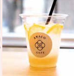
AMACO レモネード [ICE・HOT・炭酸]