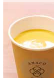
とうもろこしのポタージュ