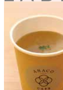
たまねぎのスープ