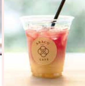
AMACOドリンク with あまおう [ICEのみ]