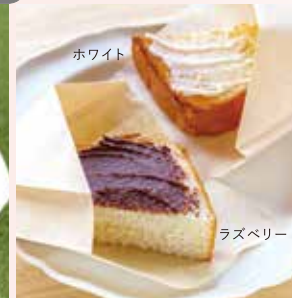
チョコレートトースト [ホワイト・ラズベリー・ミックス]