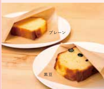
AMACO パウンドケーキ(カット) プレーン[左]