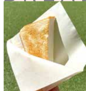
甘麹熟成食パンワンカット