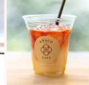
AMACOドリンク with とまと [ICEのみ]