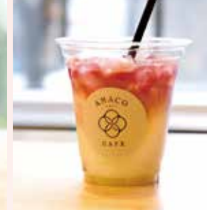
AMACOドリンク with ぶどう [ICEのみ]